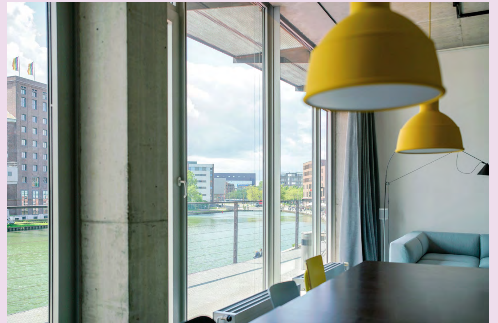
Dein „Studio with a view“ ...